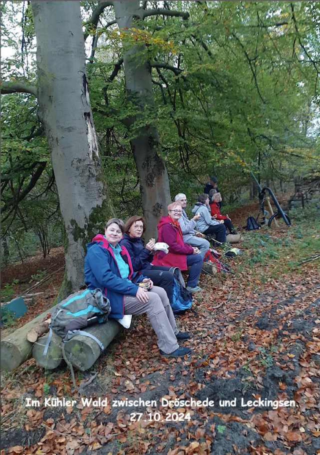
Im Kühler Wald zwischen Dröschede und Leckingsen 27.10.2024