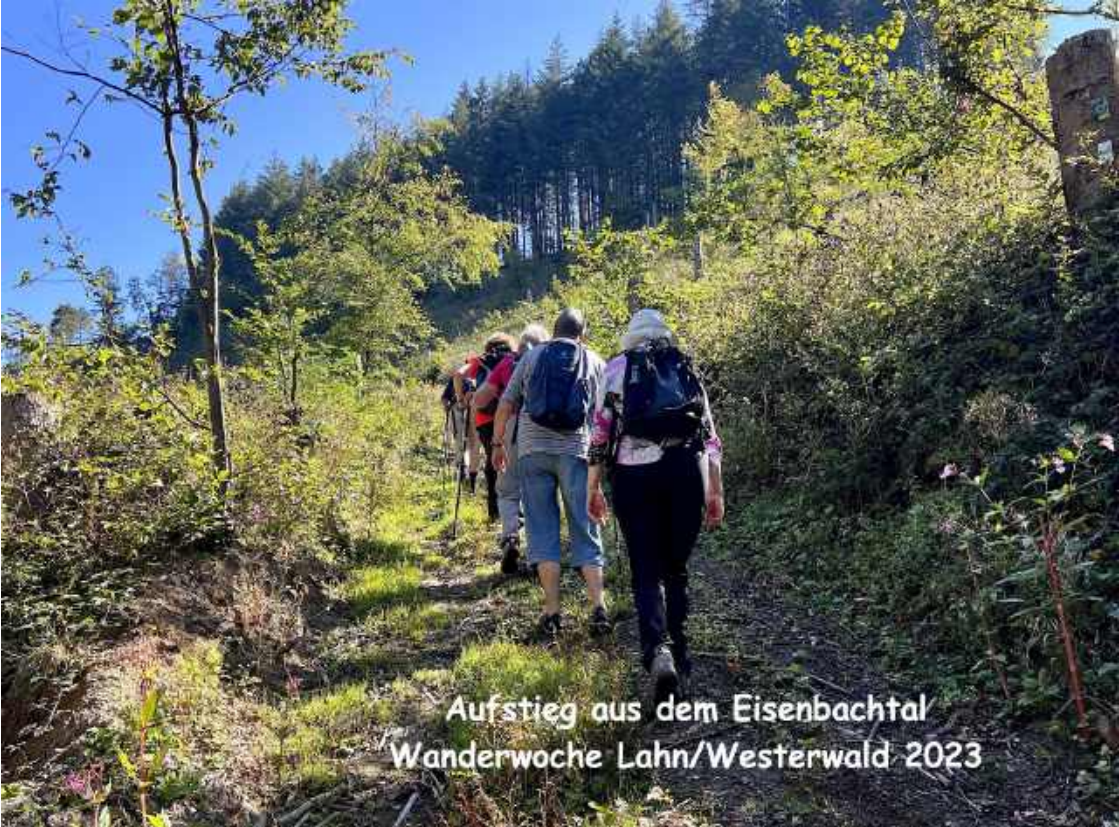
Aufstieg aus dem Eisenbachtal Wanderwoche Lahn/Westerwald 2023