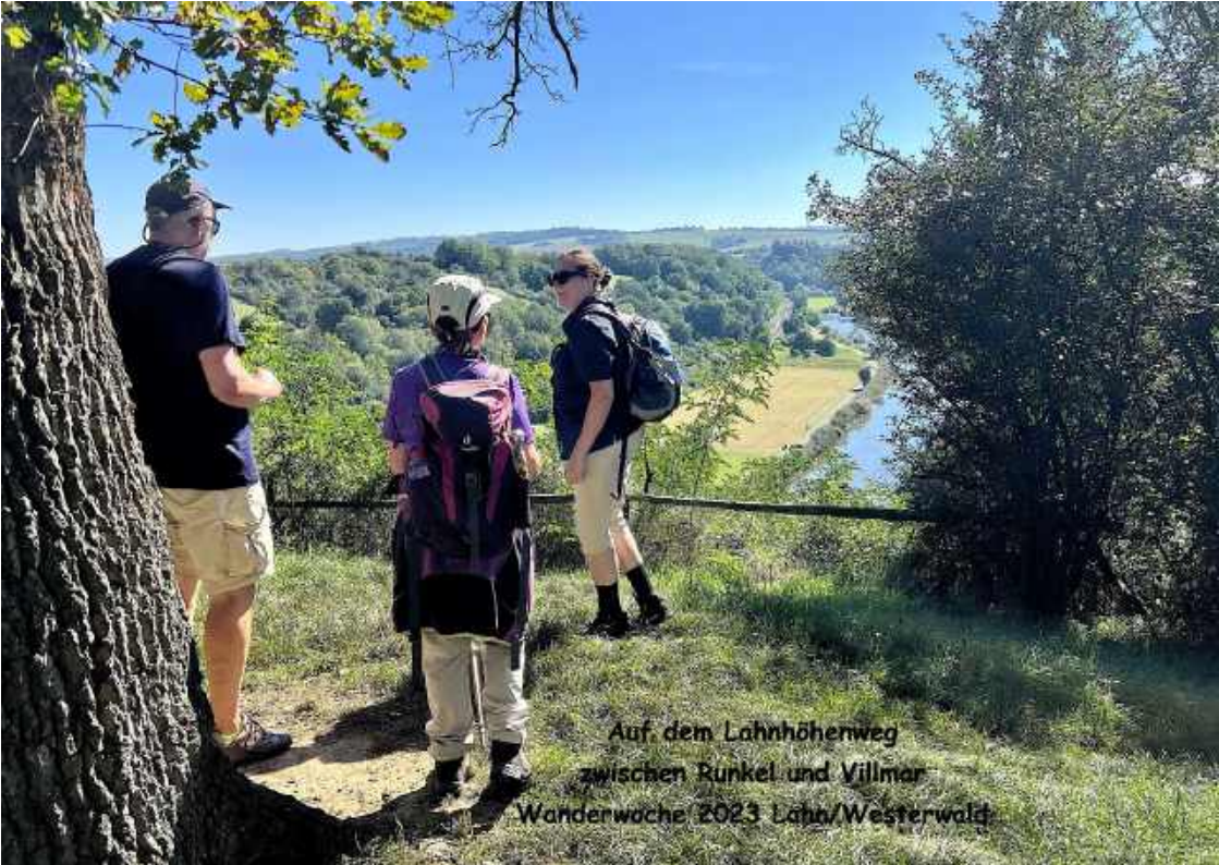
Auf dem Lahn Höhenweg zwischen Runkel und Villmar Wanderwoche 2023 Lahn/Westerwald