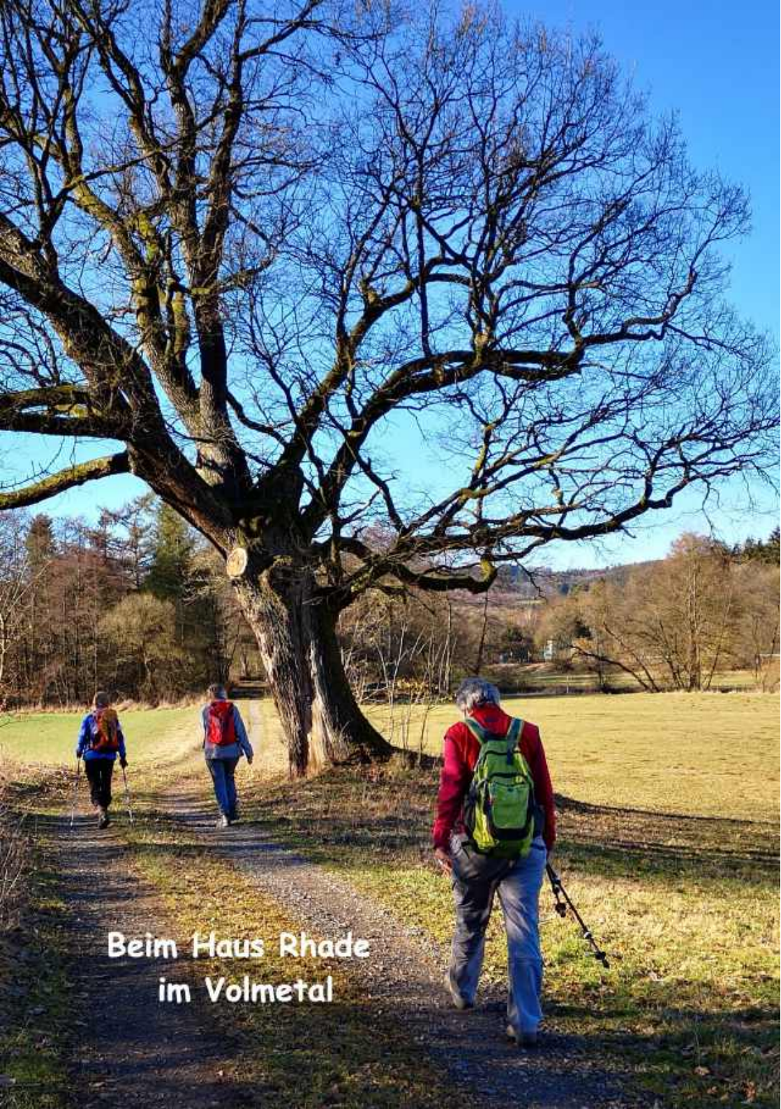
Beim Haus Rhade im Volmetal