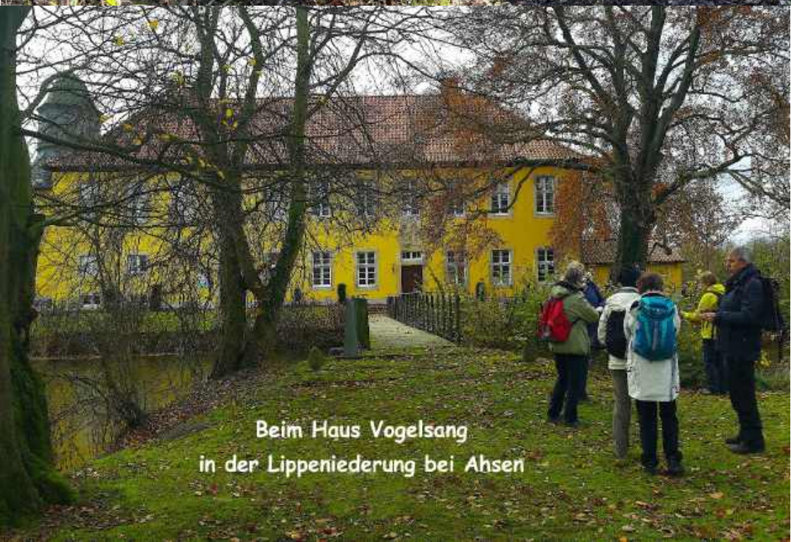
Beim Haus Vogelsang in der Lippeniederung bei Ahsen