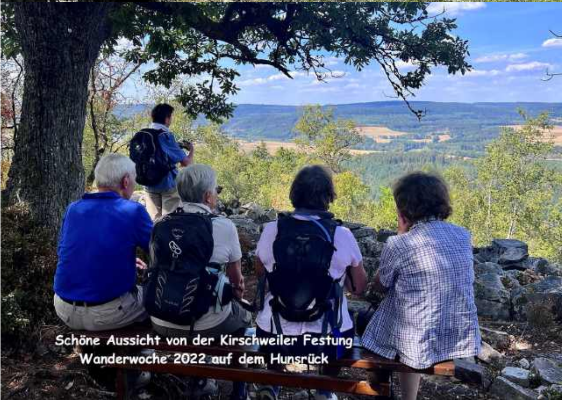
Schöne Aussicht von der Kirschweiler Festung Wanderwoche 2022 auf dem Hunsrück